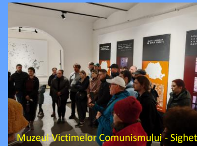
Muzeul Victimelor Comunismului - Sighet