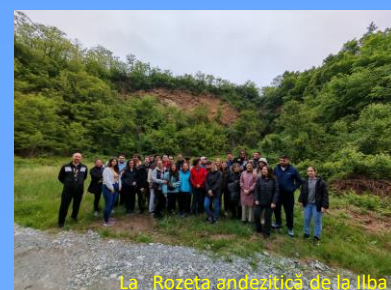
La Rozeta andezitică de la Iliș