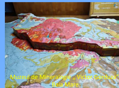
Muzeul de Mineralogie „Victor Gorduza” Baia Mare