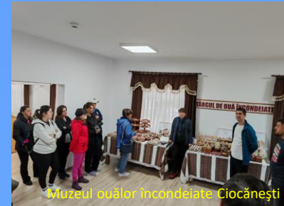
Muzeul ouălor încondeiate Ciocănești