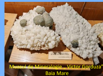
Muzeul de Mineralogie „Victor Gorduza” Baia Mare