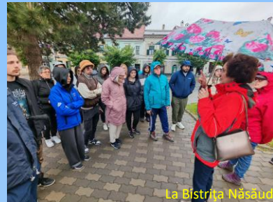
La Bistrița Năsăud