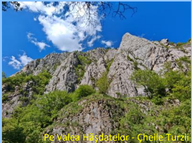
Pe Valea Hășdatelor - Cheile Turzii