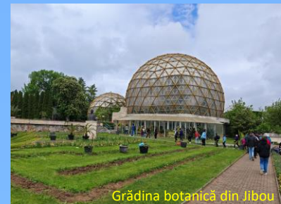
Grădina botanică din Jibou