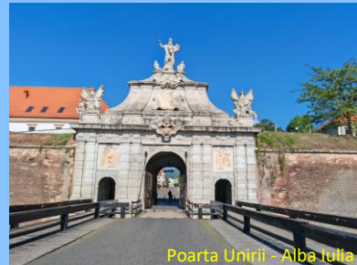
Poarta Unirii - Alba Iulia