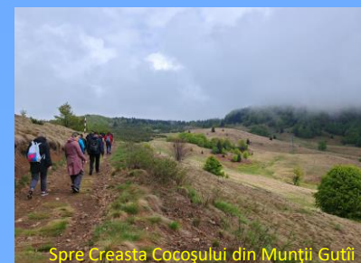
Spre Creasta Cocoșului din Munții Gutâi