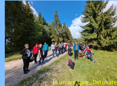
În urcare spre „Detunate”