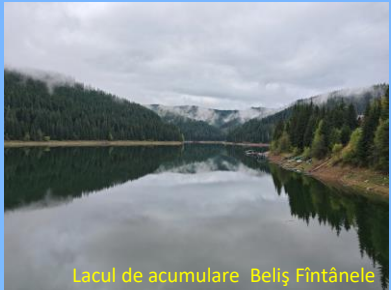
Lacul de acumulare Belș Fântânele