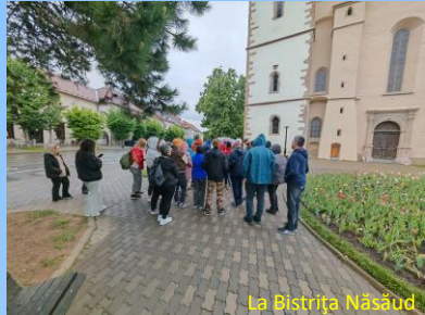
La Bistrița Năsăud