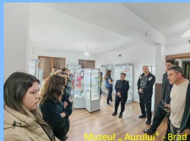
Muzeul „Aurului” - Brad