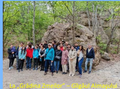
La „Grădina Zmeilor” – Gilgăul Almașului