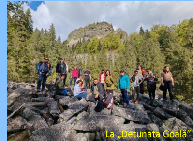
La „Detunata Goață”