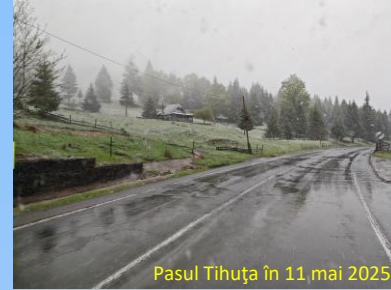
Pasul Tihuța în 11 mai 2025