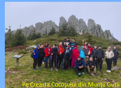
Pe Creasta Cocoșului din Munții Gutâi