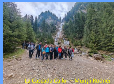
La Cascada Caltor - Munții Rodnei