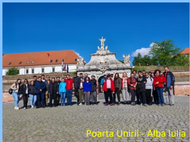
Poarta Unirii - Alba Iulia