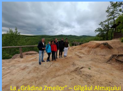
La „Grădina Zmeilor” – Gilgăul Almașului