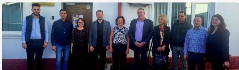
Delegația proiectului RENT la București