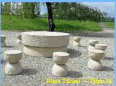
Masă Tăcească - Târgu Jiu