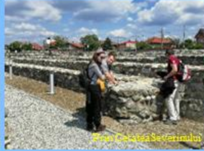
Prin Cetatea Severinului