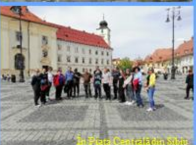
În Piața Centrală din Sibiu