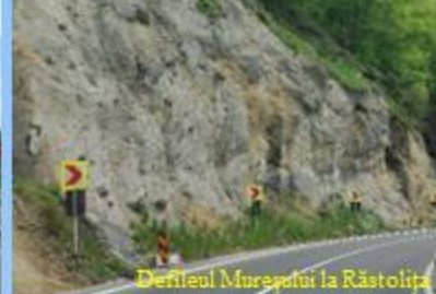
Defileul Mureșului la Răstolț