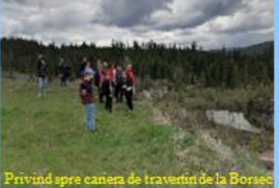
Privind spre caniera de travertin de la Borsuc