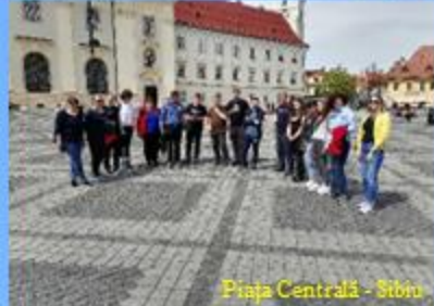
Piața Centrală - Sibiu