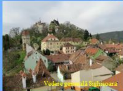
Vedere generală Sighetușoara