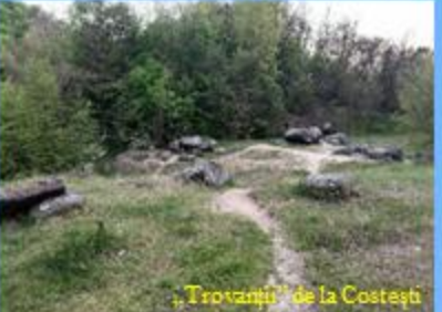
„Trovanții” de la Costești