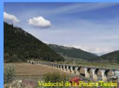
Viaductul de la Poiana Teului