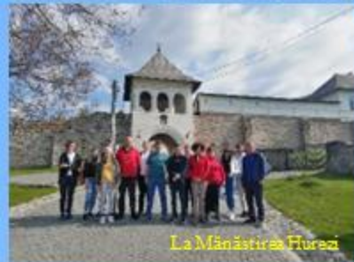
La Mănăstirea Hurezi