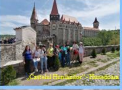
„Castelul Huniazilor” - Hunedoara