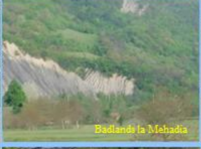
Badlands la Mehadia