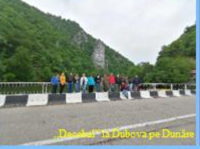
„Dassel” la Dubova pe Dunăre