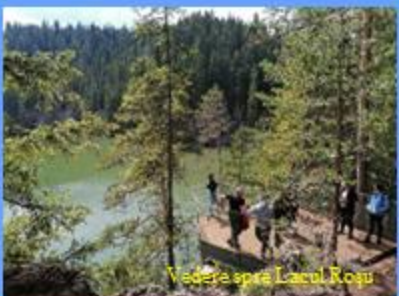
Vedere spre Lacul Roșu