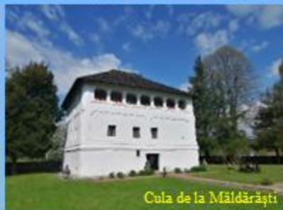
Cula de la Măldărăști