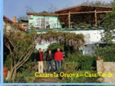
Cazare la Orșova - Casa Verde