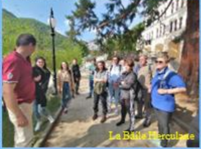
La Băile Herculane