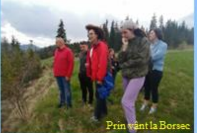
Prin vânt la Borsuc