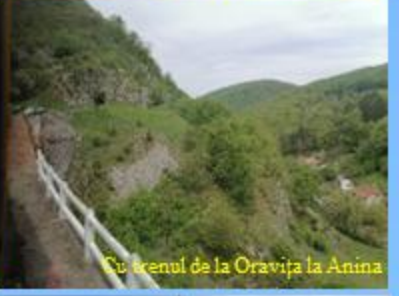
Cu trenul de la Oravița la Anina