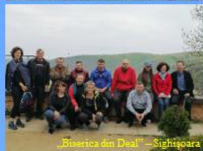
„Biserica din Deal” - Sighetușoara