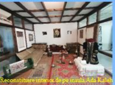
Reconstituire interior de pe insula Ada Kalah