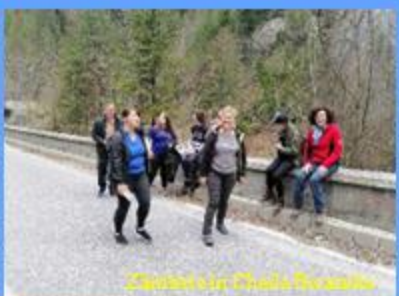
Zăpezii din Cheile Bicazului