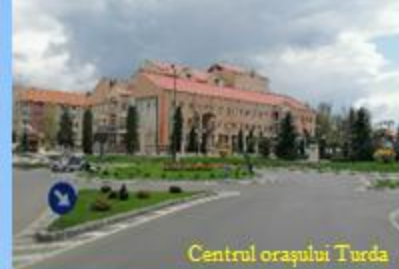
Centrul orașului Turda