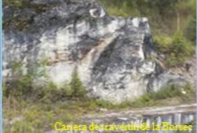
Caniera de travertin de la Borsuc