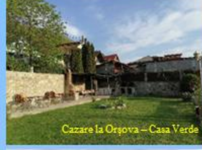
Cazare la Orșova - Casa Verde