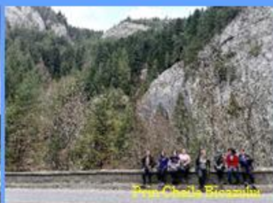
Peisajul din Cheile Bicazului