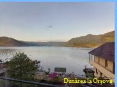
Dunărea la Orșova