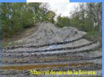
Masivul de sare de la Sovata