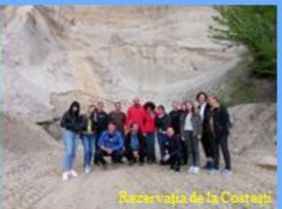
Rezervația de la Costești