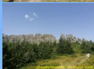
„Creasta Cocosului” din Munții Gutâi