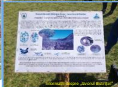
Informații despre „Izvorul Bistriței”