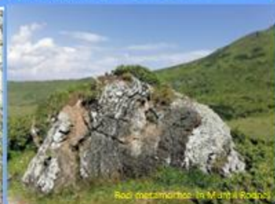
Roți metamorfice în Munții Rodnei