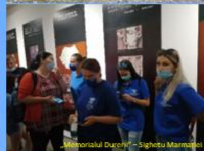
„Memorialul Durerii” - Sighetu Marmatei