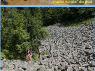
„Detunată Gosală” din Munții Apuzeni