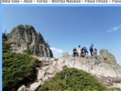
„Creasta Cocosului” din Munții Gutâi