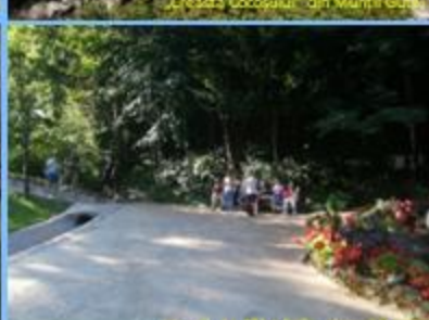
Izbul „La Călugări” – platoul Vascău