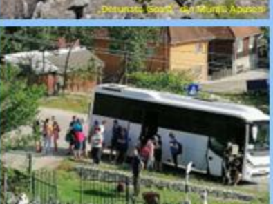
Bistrița și orașul