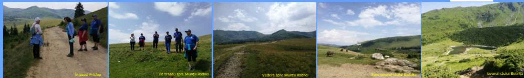
În pasul Prislop