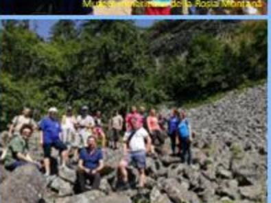
„Detunată Gosală” din Munții Apuzeni