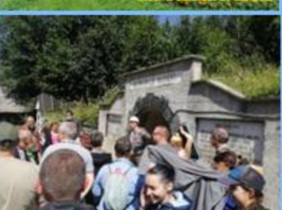
„Salcâmii Romane” de la Roșia Montană