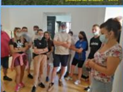
„Muzeul Aurului” din Brad