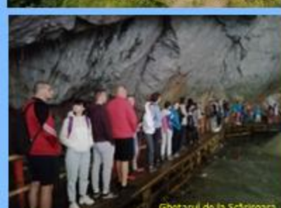
Ghetanal de la Scărișoara