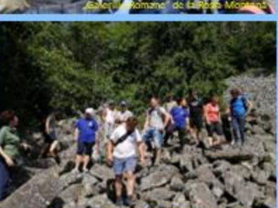
„Detunată Gosală” din Munții Apuzeni