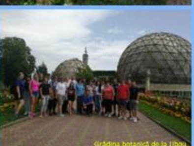
Grădina botanică de la Sibiu