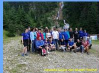
Grupada scolar din Munții Rodnei