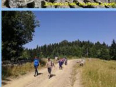
Otin nou la drum