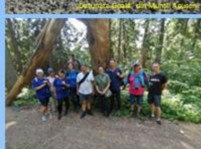
În pădure prin Munții Apuzeni