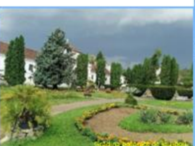
Grădina botanică de la Sibiu