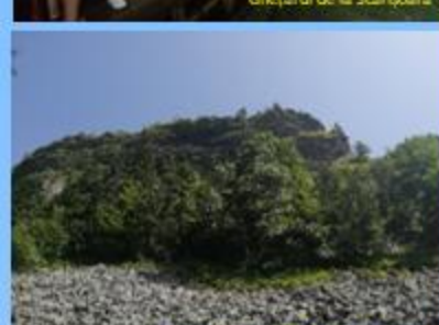
„Detunată Gosală” din Munții Apuzeni