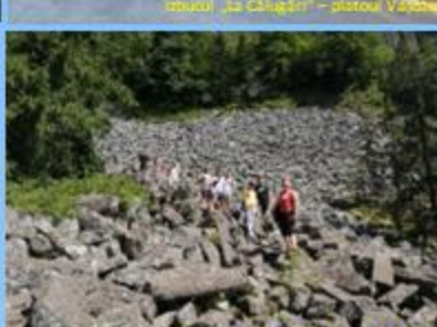
„Detunată Gosală” din Munții Apuzeni