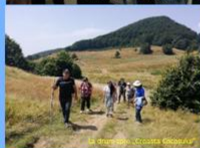
La drumul spre „Creața Cocosului”