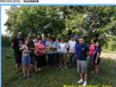
„Rozeța de andezit” Seini