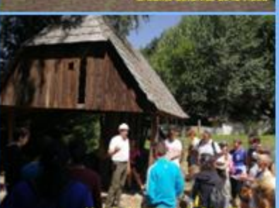
Muzeul Romanic de la Roșia Montană