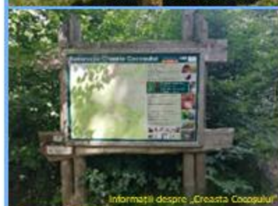
Informații despre „Creasta Cocosului”