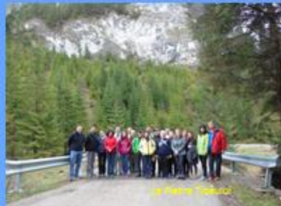
La Mihai Viteazul