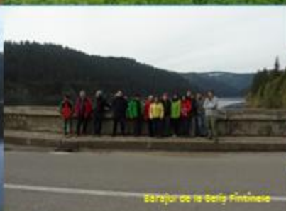
Stațiunea de la Beliș Fântânele