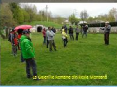
La Galeriile Romane din Rospia Montană