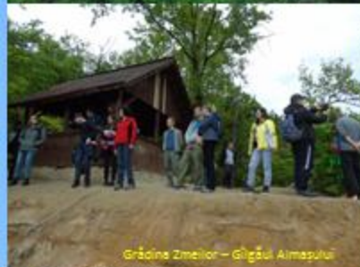
Grădina Zmeilor – Giğăușu Almasului