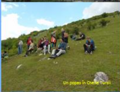
Un popas în Cheile Turzii