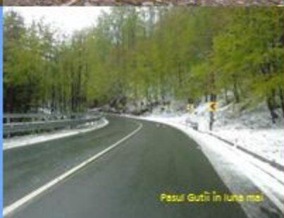
Pasul Gutâi în luna mai