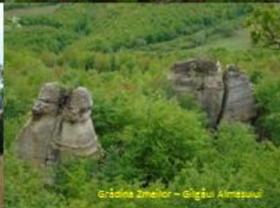
Grădina Zmeilor – Giğăușu Almasului