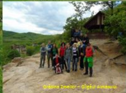
Grădina Zmeilor – Giğăușu Almasului