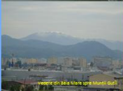
Vedere din Bala Mare spre Munții Gutâi