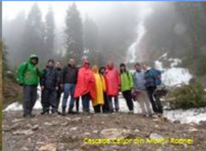
Cascada Cailor din Munții Rodnei