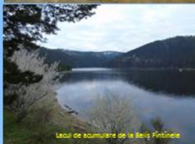
Lacul de acumulare de la Beliș Fântânele