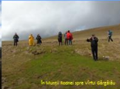
În Munții Rodnei spre Vîrtul Gârgășu