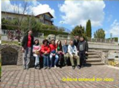
Grădina botanică din Jibou