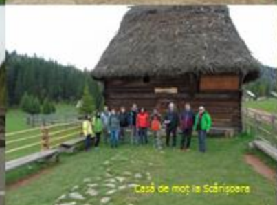
Casă de moș la Scărișoara