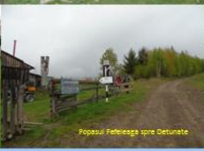
Popasul Feteleaga spre Detunete