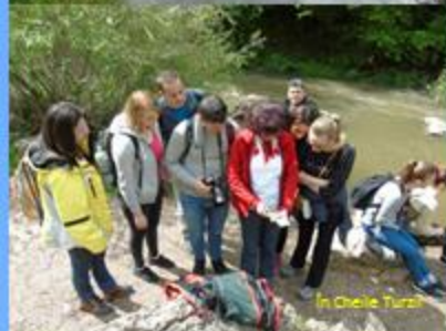
În Cheile Turzii