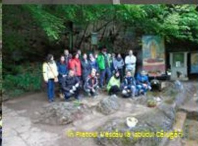
În Platoul Vașcău la Izbuclu Călugări