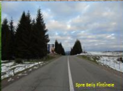
Spre Beliș Fântânele