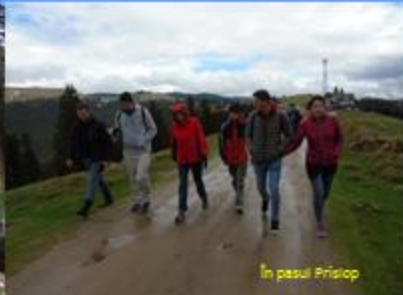
În pasul Prislop