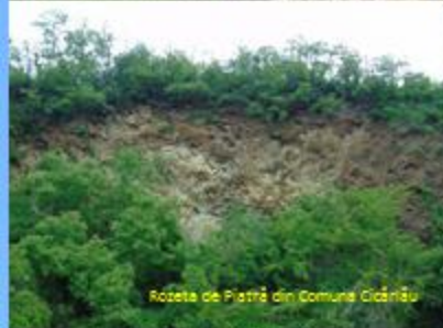
Rozeta de Piatră din Comuna Cioclovățeni