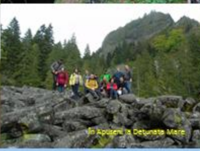
În Așezarea Detunete Mare