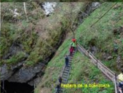
Pesteră de la Scărișoara