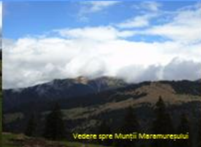
Vedere spre Munții Maramureșului