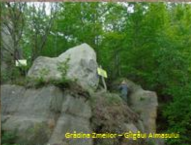
Grădina Zmeilor – Giğăușu Almasului