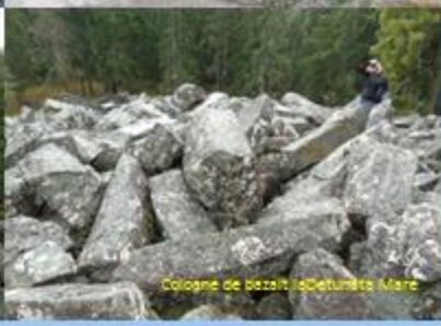
Coloane de bazalt Detunete Mare