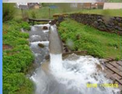
Beliș - Viteaz